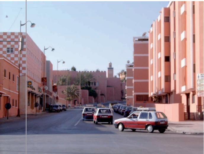
شارع محمد الخامس بالعيون

إذا كانت مدينة العيون قد أعلنت مدينة بدون صفيح سنة 2008، فان عمليات إعادة إيواء قاطني مخيمات الوحدة بوجدور تسير كما كان مسطرا لها حيث إلى حدود منتصف شهر نونبر 2009 بلغ عدد المستفيدين من البقع بمختلف التجزئات بمدينة بوجدور 2942 أسرة، على أن تتم إعادة إيواء باقي الأسر خلال هذه السنة